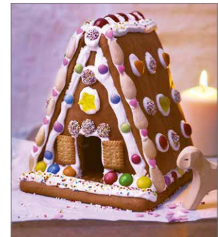
Von Kipferln bis Lebkuchen