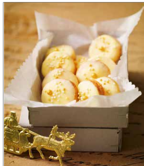
Von Butterplätzchen bis Zimtstern