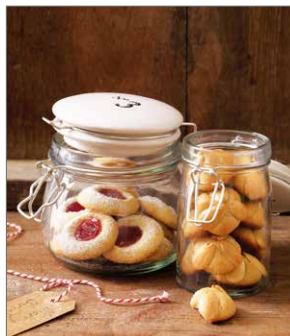
Von Kipferln bis Lebkuchen