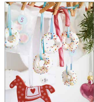
Von Makronen bis Spritzgebäck