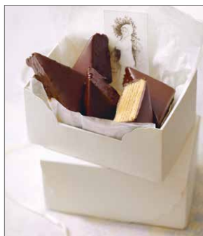
Von Magenbrot bis Honigkuchen