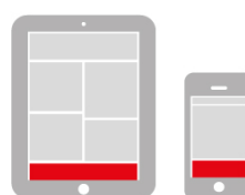
MOBILE STICKY FOOTER 300 x 100 px