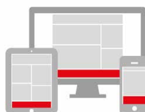
STICKY FOOTER 300 x 100 px + 728 x 90 px