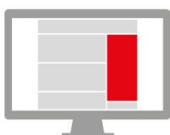
HALFPAGE AD 300 x 600 px