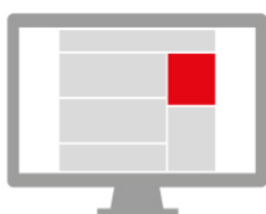
MEDIUM RECTANGLE 300 x 250 px 580 x 400 px