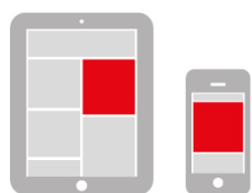
MOBILE MEDIUM RECTANGLE 300 x 250 px