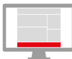
STICKY FOOTER 728 x 90 px