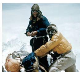
Bild: Tenzing und Hillary Erstbesteigung