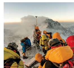
Bild: Klimaforschung // oder // Wetterstation

Warum schmilzt das ewige Eis? Die höchste Wetterstation der Welt soll Antworten liefern. Sie wurde im Jahr 2019 auf dem „Balkon“ aufgestellt, aber bald durch einen Sturm zerstört. Im Frühling 2022 kehrten Klimaforscher zurück. Sie ersetzen die Station durch eine robustere und präzisere – noch weiter oben auf dem „Bishop Rock“ knapp unter dem Gipfel.