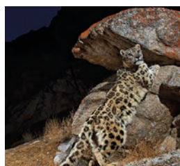
Bild: Schneeleopard