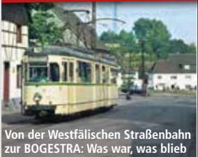
Von der Westfälischen Straßenbahn zur BOGESTRA: Was war, was blieb